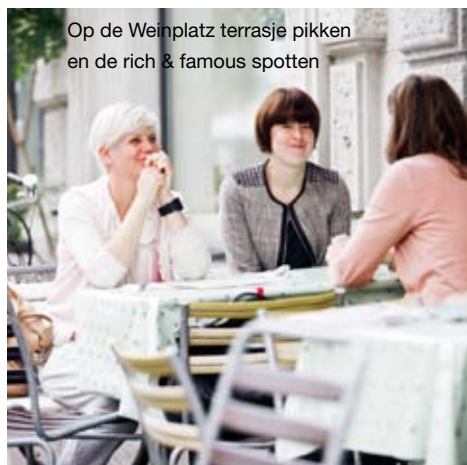
Op de Weinplatz terrasje pikken en de rich & famous spotten