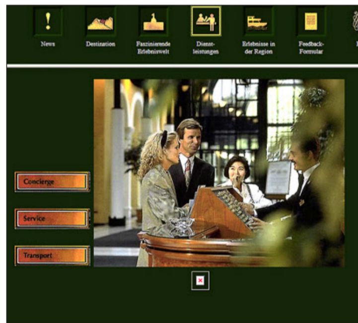
Eine der ersten Websites des Victoria-Jungfrau Grand Hotel & Spa.